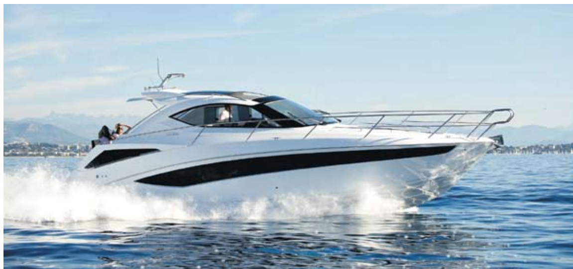
Galeon 385 HTS wchodzi w ślizg po 14 sekundach od startu.

385 HTS kryje w kadłubie dwie dwuosobowe kabiny mieszkalne. W dziobowej, poza typowym dwuosobowym łóżkiem w środkowej części, jest miejsce na dużą szafę, wygodny fotel na prawej burcie, sprytnie ukrytą toaletkę z dużym podświetlanym lustrem oraz drzwi